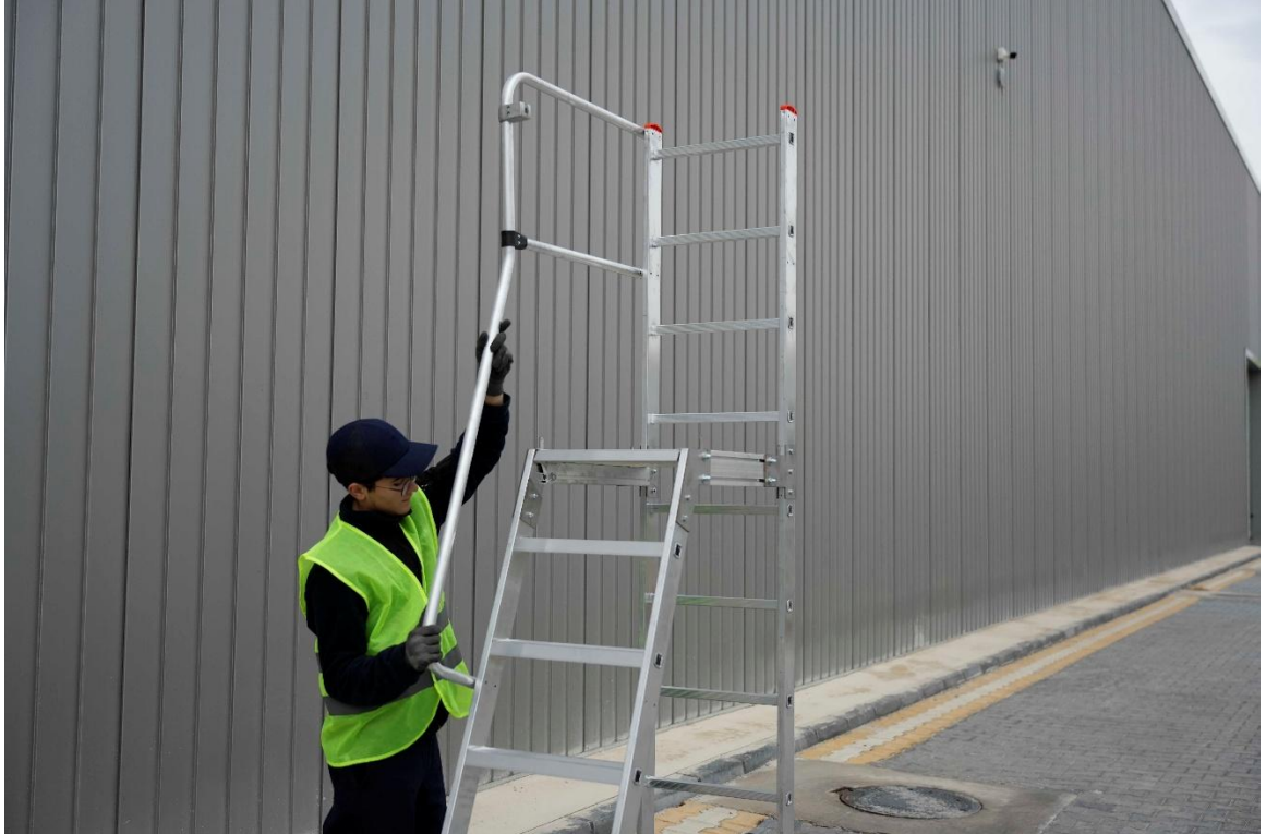
Sol korkuluğu yerine koyun.