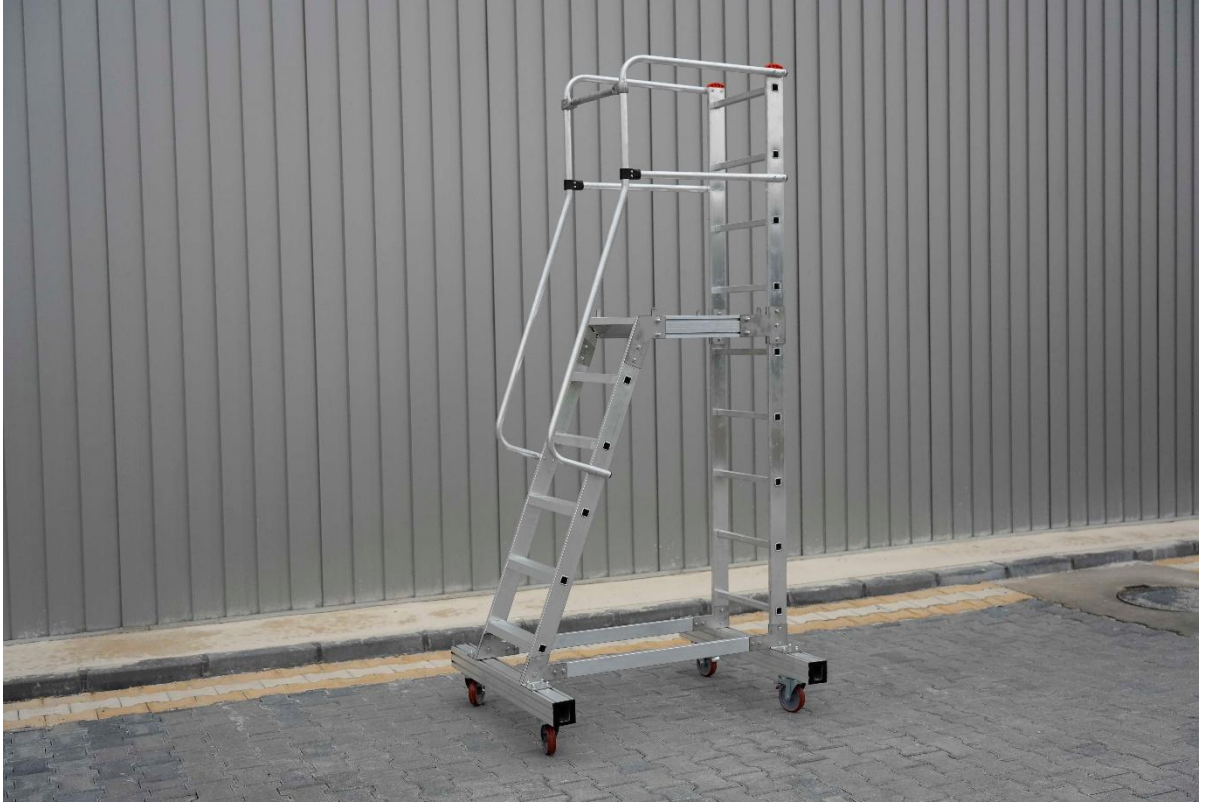
Ařama sonrası gūncel durum.