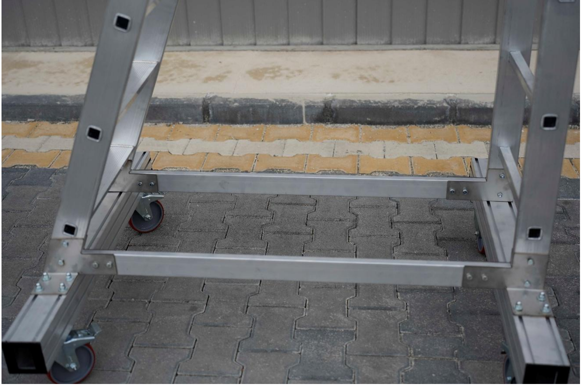
Aşama sonrası güncel durum.