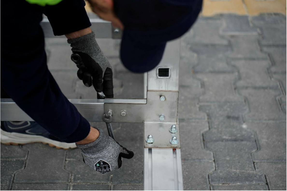
Anahtar yardımı ile vidaları sıkın.