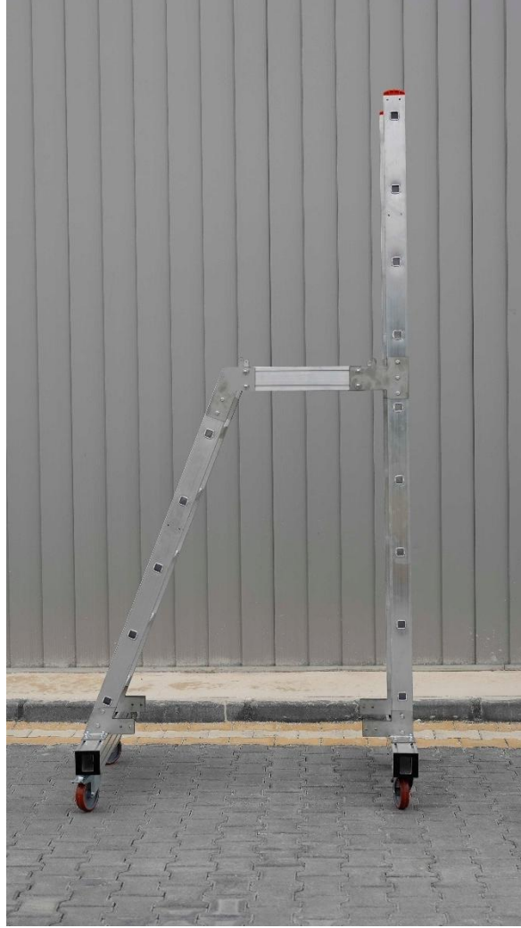
Aşama sonrası güncel durum.