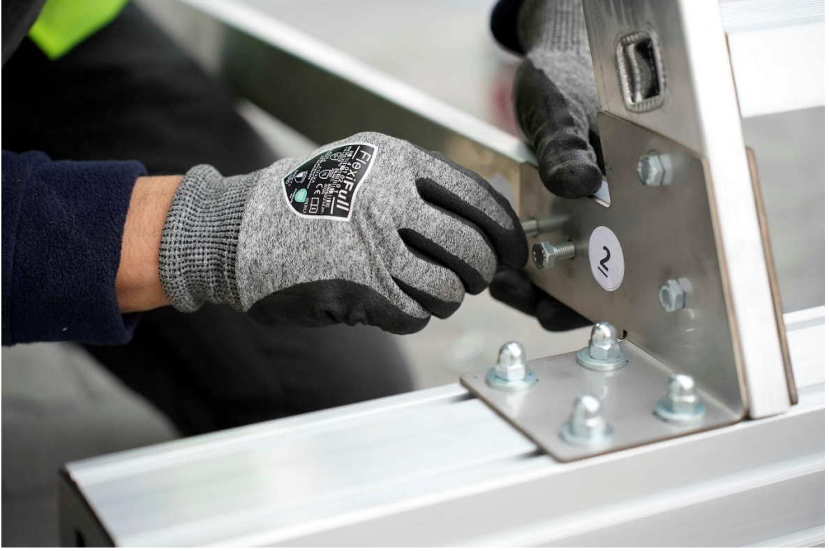
Vidaları yerine yerleştirin.