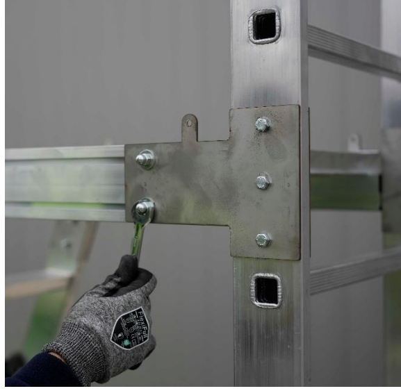
Anahtar yardımı ile vidaları sıkın.