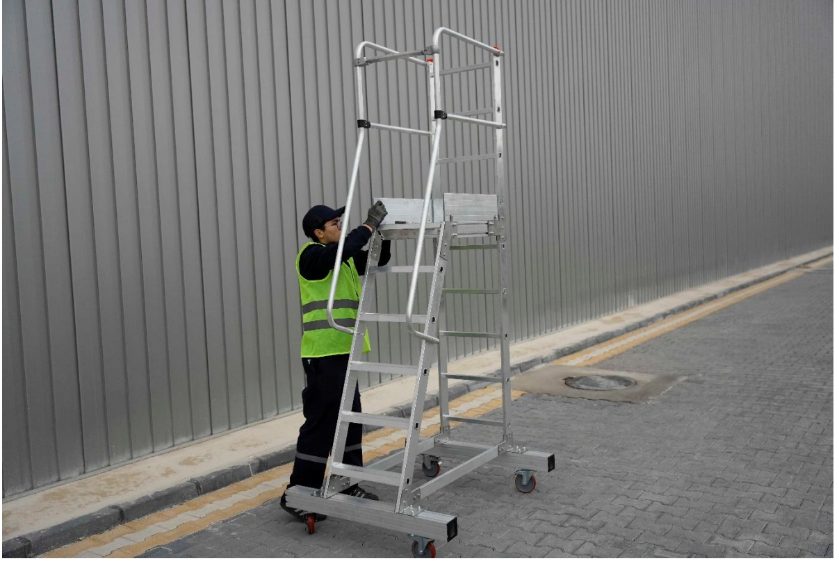
Topukluđu yerine yerleřtirin ve 4 adet vida somun ile yerine sabitleyin.